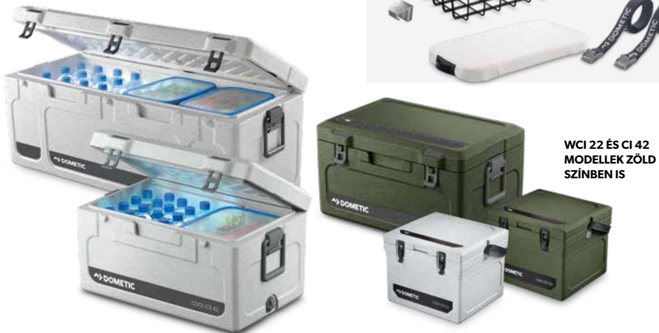
WCI 22 ÉS CI 42 MODELLEK ZÖLD SZÍNEN IS

A műszaki tartalom, specifikációk és kiegészítők a műszaki fejlődés érdekében változhatnak.